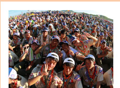
#17NSJ フォトコン # 最高の仲間 # 開会式

ジャンボリーで撮れた思い出の1枚を発信! 映える、絵になる・・・とっておきの瞬間待っています!