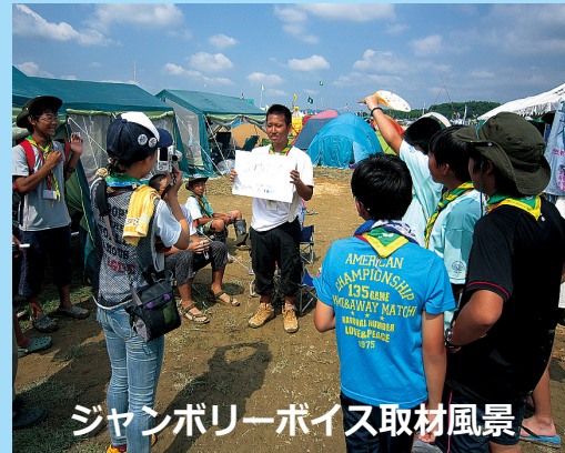
ジャンボリーボイス取材風景