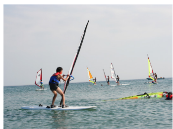
#17NSJ フォトコン # 海 # 風を感じる